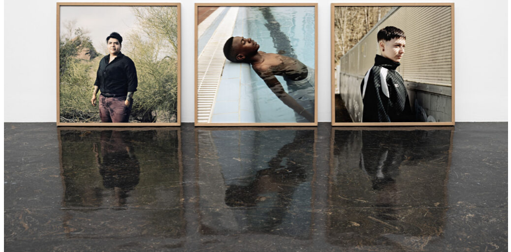
Linda Bournane Engleberth sin fotoserie Outside The Binary - handler om 6 portretter av mennesker som identifiserer seg utenfor tokjønnsmodellen.

(/wp-content/uploads/2023/09/DSL_3384-e1694367347231.jpg)